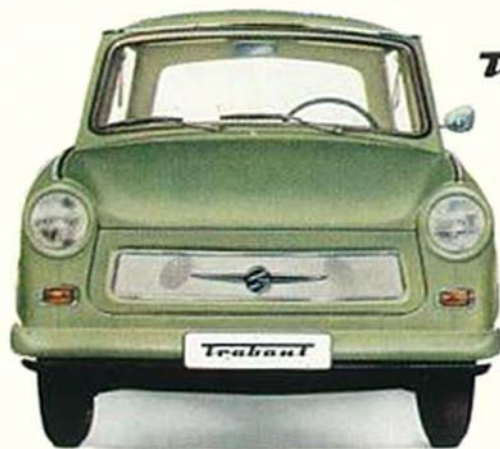
Trabant 601 universal

„Universal“ bedeutet: vielseitig, zahlreiche Verwendungsmöglichkeiten, mehrere Wagen zugleich mit nur einem einzigen Automobil – für Beruf und Gewerbe, für die Familie, als gro-